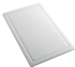
Tagliere in HDPE 8657 001